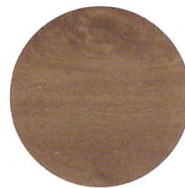
Color imitación madera, roble oscuro