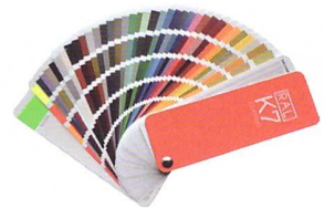
Colores RAL (opcional)